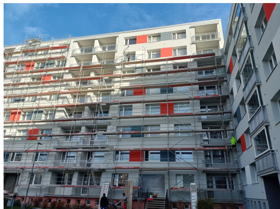
FOTO PO REALIZACI AKCE