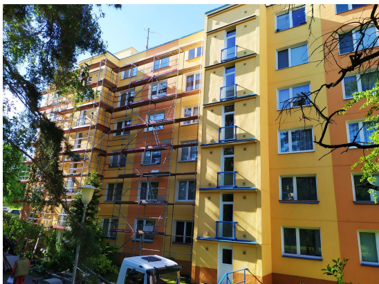
FOTO PŘED REALIZACÍ AKCE